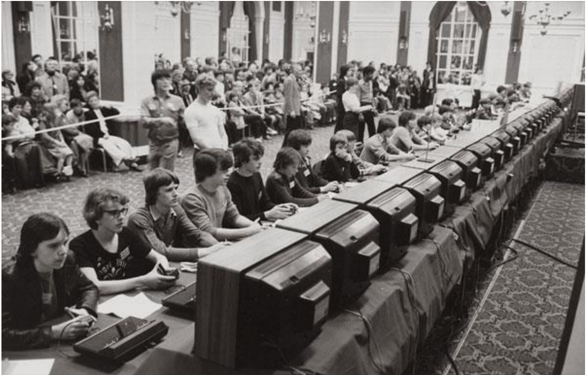
Figura 1: Primeiro Torneio de eSports